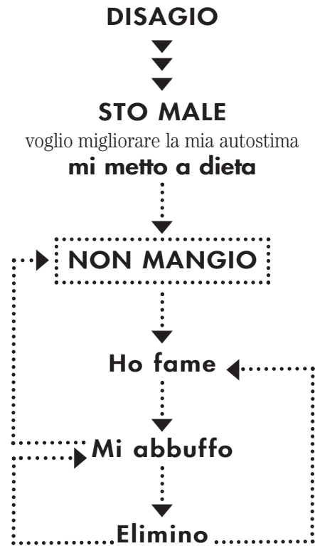
Figura 2. Disturbi del Comportamento Alimentare: dal disagio ai meccanismi automatici di mantenimento dei sintomi (circoli viziosi)

danni fisici più o meno gravi causati dai DCA. Si impara insomma a convivere con il disagio, il dolore fisico, la paura, la necessità di organizzarsi e di stare soli, il rischio di compromettere relazioni e progetti di vita pur ritenuti importanti e il pericolo di complicanze gravi anche mortali.